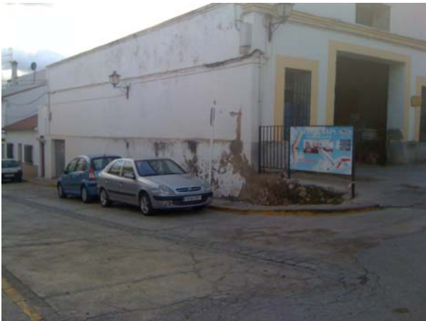
Richtung Ganterfly Appartements