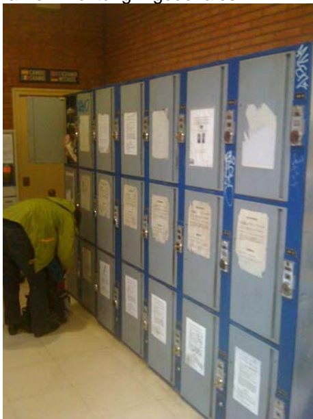
Schließfächer am Busbahnhof

Am Busbahnhof sind Schließfächer in die auch Gleitschirme passen (ca. 2 Euro) und die Busse fahren Richtung Algodonales.