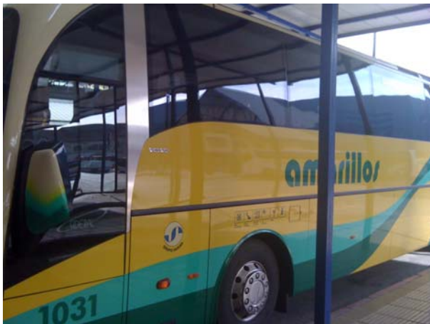
Bus Richtung Algodonales