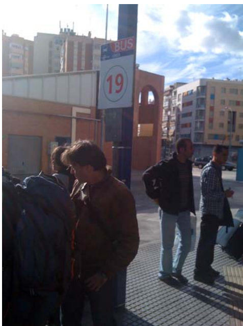
Ausstieg am Busbahnhof Malaga