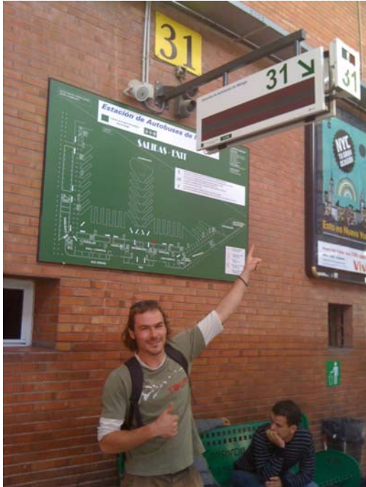
Abfahrt Richtung Algodonales vom Busbahnhof Malaga