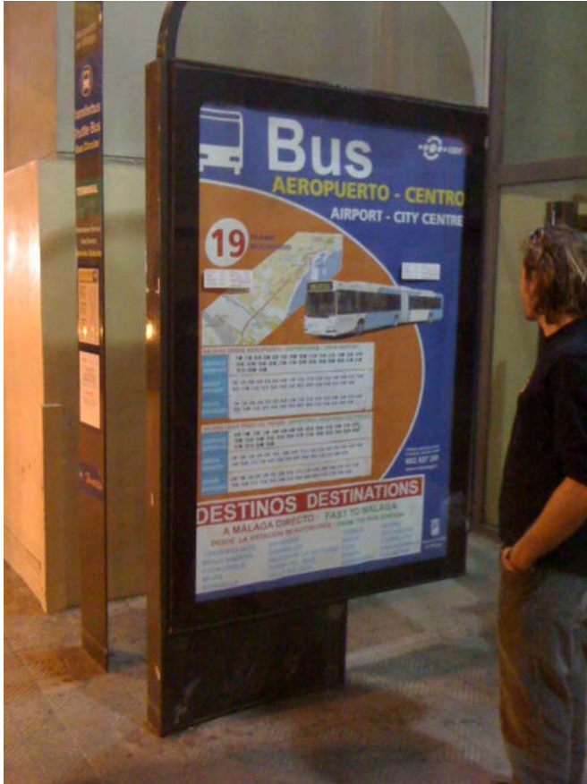
Linie 19 Richtung Malaga Innenstadt/Weiterfahrt Algodonales, Abfahrt Terminal 2 am Ausgang