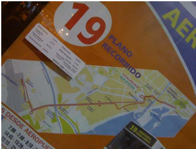
Aussteigen am Busbahnhof